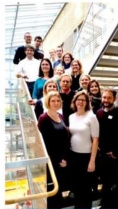
NJF MEETING GOTHENBURG 2016